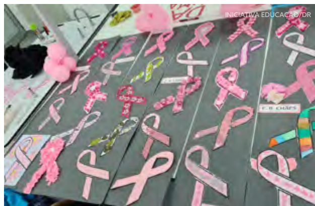
Trabalhos elaborados pelos alunos Ser Pro, alusivos ao «Outubro Rosa»