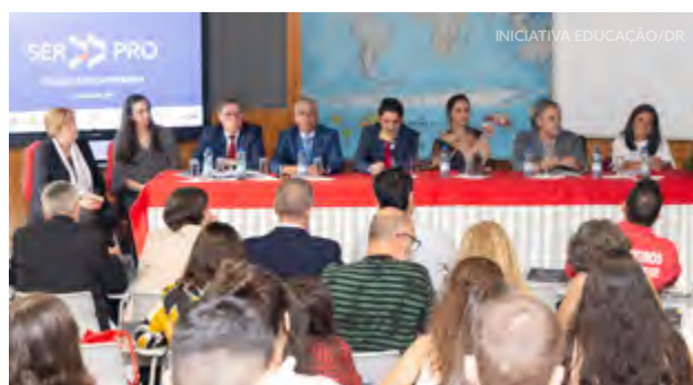
Agrupamento de Escolas Morgado Mateus, Vila Real

Já no Porto, associou-se ao Ser Pro o Curso Profissional de Técnico de Manutenção Industrial, com variante de Mecatrónica, do Agrupamento de Escolas Infante D. Henrique, e, em Portimão, o Curso Profissional de Técnico de Turismo, do Agrupamento de Escolas Poeta António Aleixo.