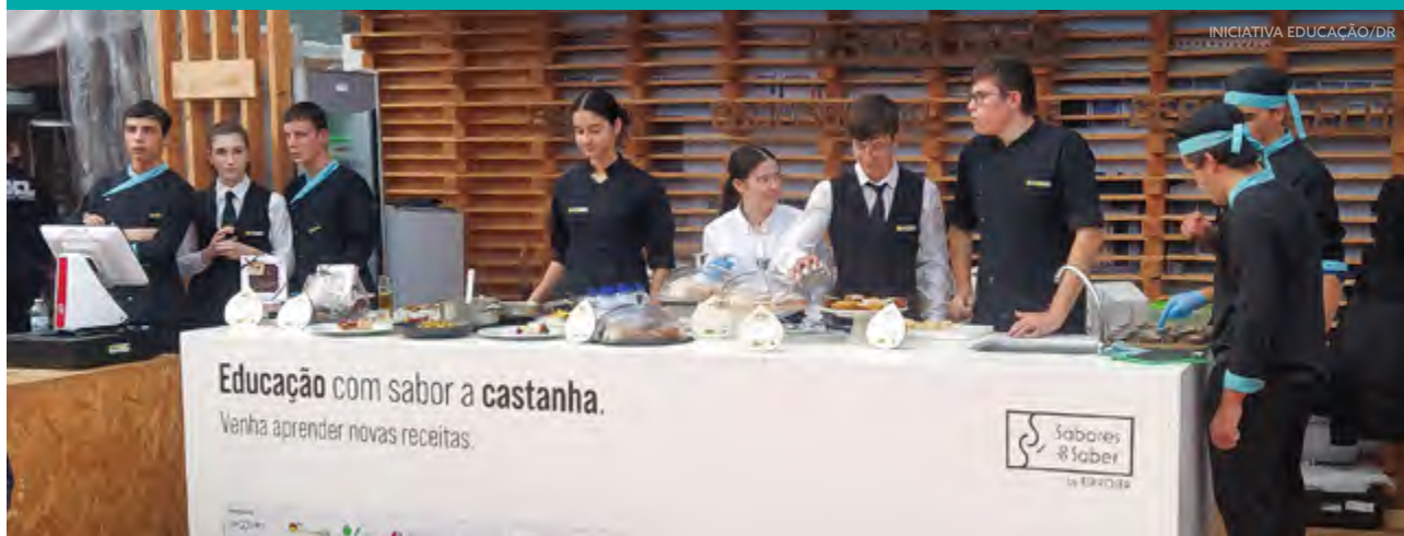
Alunos Ser Pro na Festa da Castanha