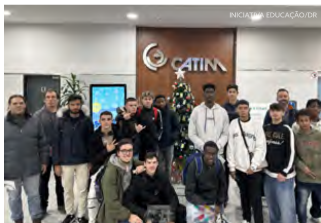
Alunos Ser Pro e docentes na visita de estudo ao CATIM

Durante a atividade, os alunos tiveram a oportunidade de adquirir novos conhecimentos sobre o conceito, domínio e instrumentos de medição da Metrologia e de experienciar alguns conteúdos lecionados no curso, como os ensaios de medição para a calibração de equipamentos de medida.