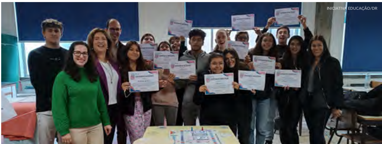
Alunos, docentes, investigadores e perita Ser Pro

Durante os meses de outubro, novembro e dezembro, o Agrupamento de Escolas Morgado Mateus organizou vários workshops , palestras e visitas de estudo direcionadas aos alunos do Curso Profissional de Técnico de Auxiliar de Saúde.