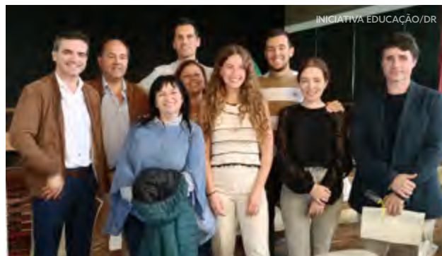
Palestrantes, docentes e alunos Ser Pro

De acordo com os professores que também assistiram à palestra, a atividade «superou todas as expectativas e despertou muito interesse nos alunos».