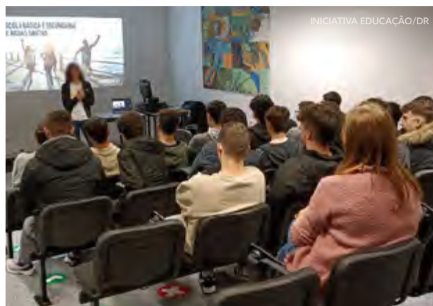
Alunos Ser Pro participam no workshop da Adidas

Colaborar na planificação de atividades educativas entre as empresas e a escola, com vista a promover uma integração mais sólida dos alunos em ambiente de trabalho, proporcionando-lhes um melhor conhecimento das condições e exigências de cada área profissional, é um dos principais objetivos do programa Ser Pro.