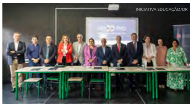
Agrupamento de Escolas Infante D. Henrique, Porto