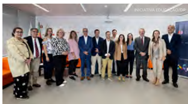
Agrupamento de Escolas Poeta António Aleixo, Portimão