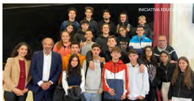
Alunos, docentes, coordenação e perito Ser Pro

O FOR-MAR – tem contribuído para a consolidação da vertente náutica e marítima nos Cursos Profissionais de Técnico em Animação de Turismo do Agrupamento de Escolas Aquilino Ribeiro em Oeiras, de Turismo da Escola Profissional em Turismo de Aveiro e de Desporto do Agrupamento de Escolas de Ílhavo. Este parceiro Ser Pro tem possibilitado aos alunos a participação em formações certificadas e em treinos práticos no mar, destacando-se a formação de Marinheiro de 2. a Classe do Tráfego Local.