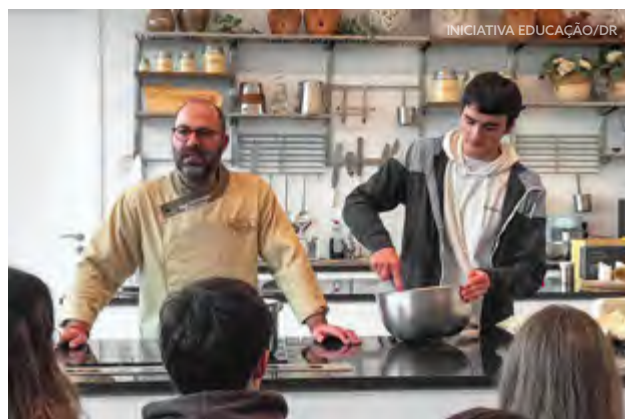
Alunos Ser Pro aprendem novas receitas com castanha