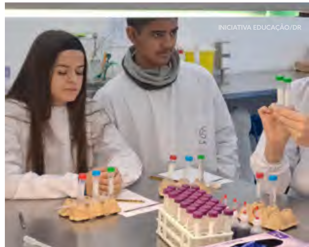
Alunos Ser Pro e investigadora na preparação de amostras

Durante a visita de estudo, os futuros Técnicos Auxiliares de Saúde puderam aplicar e testar técnicas de diagnóstico utilizadas nos laboratórios de investigação.