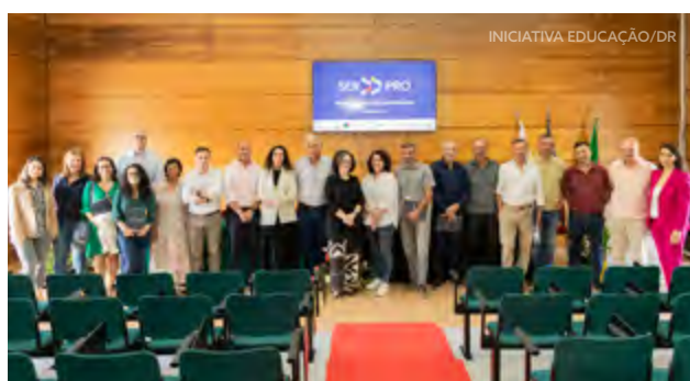
Escola Profissional de Agricultura e Desenvolvimento Rural de Carvalhais/Mirandela